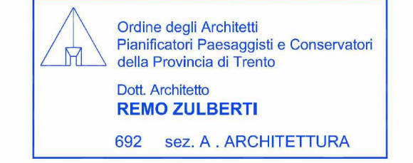
Tavola: B.3 Scala 1:2.000